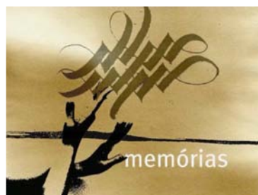
Figura 2: Imagens dos genéricos das rubricas Minuto Internet e Memórias.